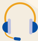
MS AND DEMAND DRIVEN